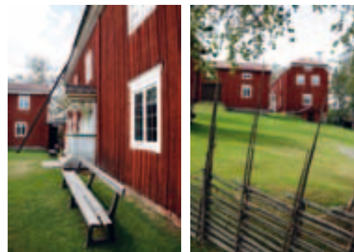
Une riche collection d'objets rustiques se trouve dans cette ferme.