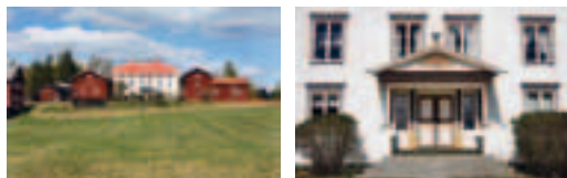
La ferme Pallars, à Långhed, et ses perrons couverts richement décorés.

LES VILLAGES DE NÄSBYNN ET LÅNGHED SE TOUCHENT PRESQUE. C'est ici le centre des grands bâtiments des paysans du Hälsingland. Ici se dressent les bâtiments principaux de près de 400 mètres carrés de surface habitable et autant de surfaces non utilisées sur des moitiés d'étages et des greniers tout entiers,