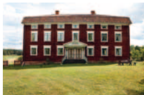
Pallars fait partie des fermes candidates au patrimoine de l'humanité et c'est l'une des plus grandes.