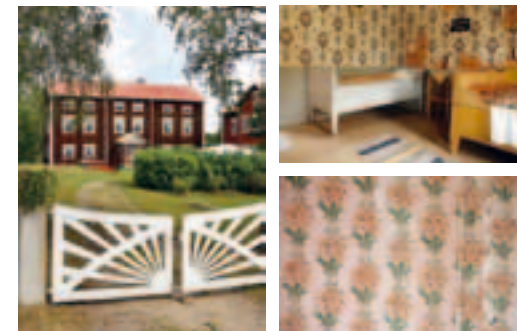
La grande ferme Ol-Svens a conservé le bois nu.

La route est une voie de circulation très ancienne, mais certaines parties ont été améliorées et changées au cours des années. Sur les hauteurs, on peut admirer les grands paysages forestiers du Hälsingland et ses montagnes bleutées. Un point de vue se trouve près de Vinberg sur la rivière Voxnan et le système de lacs. D'ici, la vue vertigineuse s'étend sur la rivière et le paysage agricole.