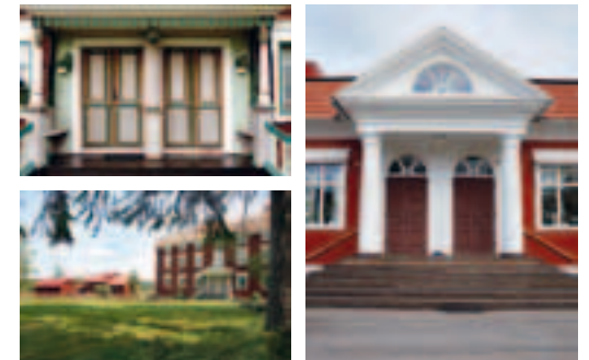
C'est l'école paroissiale d'Alfta qui a inspiré le magnifique perron couvert de la ferme Jon-Lars, à Långhed.