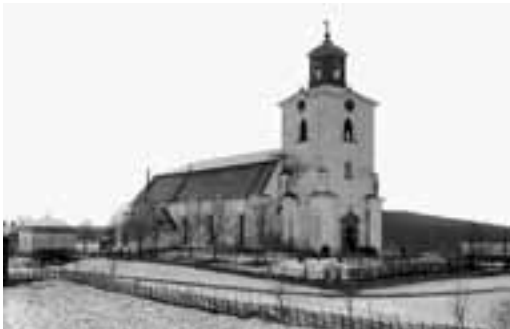
L'église d'Alfta vue de l'école paroissiale.

À ALFTA, L'ÉGLISE, LE PRESBYTÈRE, L'ÉCOLE ET LE QUARTIER DE LA GARE sont très proches les uns des autres, et il est rare de trouver des ornements de bois aussi riches qu'ici. Ce village est considéré comme le mieux conservé de cette sorte. Après le grand incendie de 1793, une nouvelle société florissante a été rapidement édifée. Un nouveau presbytère était déjà en place l'année suivante et, quelques années plus tard, la reconstruction de l'église était terminée.