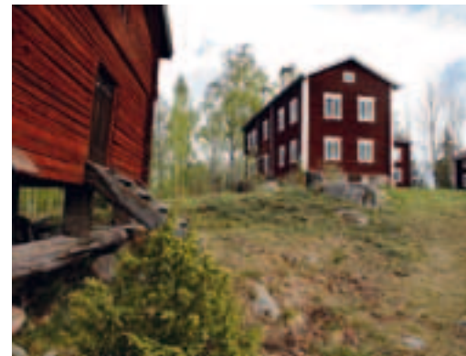
Ol-Anders a été transférée sur un emplacement caractéristique.

ont été épargnées, d'où son nom. C'est pourquoi de nombreuses fermes y portent encore les marques de construction du XVIIIe siècle. Près des fermes Per-Ols, Hansers, Jon-Knuts, Ol-Mårs et Skindra se trouvent aussi bien des remises que des parties de bâtiments principaux datant de deux siècles et plus.