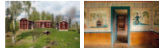
La ferme a été ornée de perrons couverts magnifiquement décorés et de peintures de couleurs vives.

l'incendie, on entreprit tout de suite la reconstruction de la nouvelle ferme, mais sur un emplacement plus sûr, une colline du village paroissial Est.