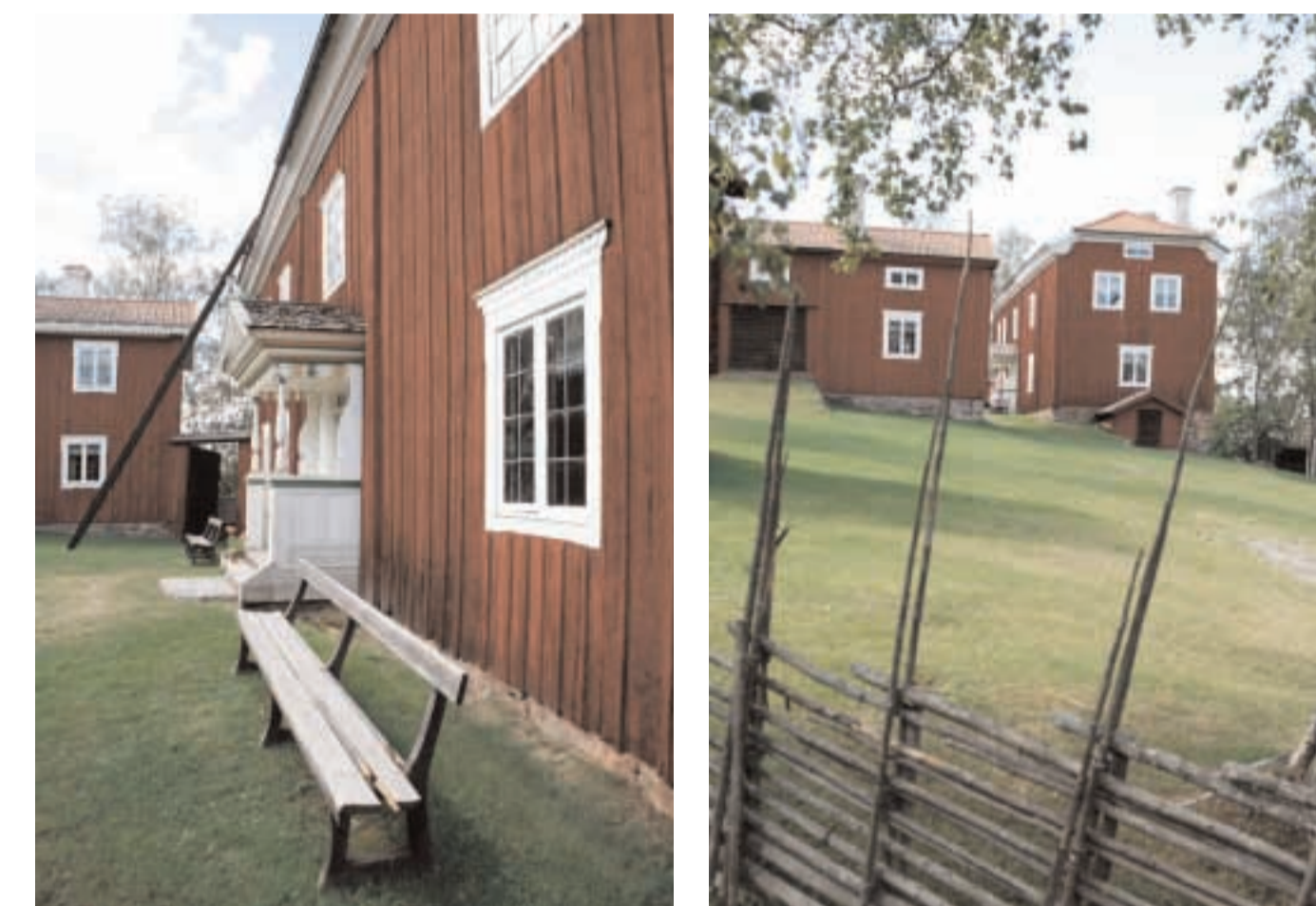
Gårdstunet vid gården Mårtes med sina stora rödmålade hus.