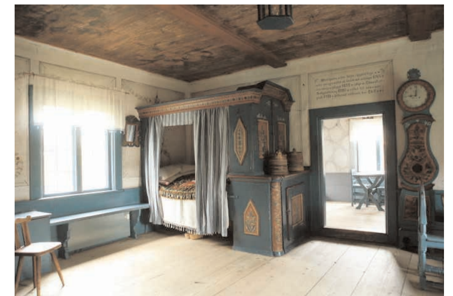
En rik samling allmogeföremål finns vid gården.