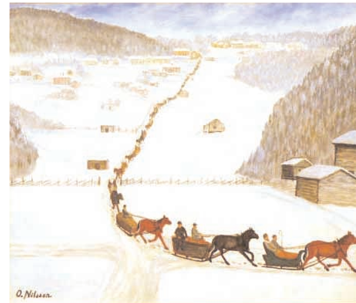
Jämtarna kommer till Knåda marknad, målning av Olof Nilsson.

Hälsingegårdsvägen i Falun omvittnar än idag om dessa handelsförbindelser. Marknaderna var viktiga för böndernas ekonomi men också för folket i övrigt. Pigor och drängar var också där och kunde knyta kontakter och handla varor. För gårdarna i Knåda blev marknaden en inkomstkälla. Vid vissa gårdar hyrde man ut för övernattnings, vid andra var det krog vid en tredje uppläts lokaler för trolleri och akrobatik och mitt i allt sträckte sig marknadsgatan och ett marknadstorg.