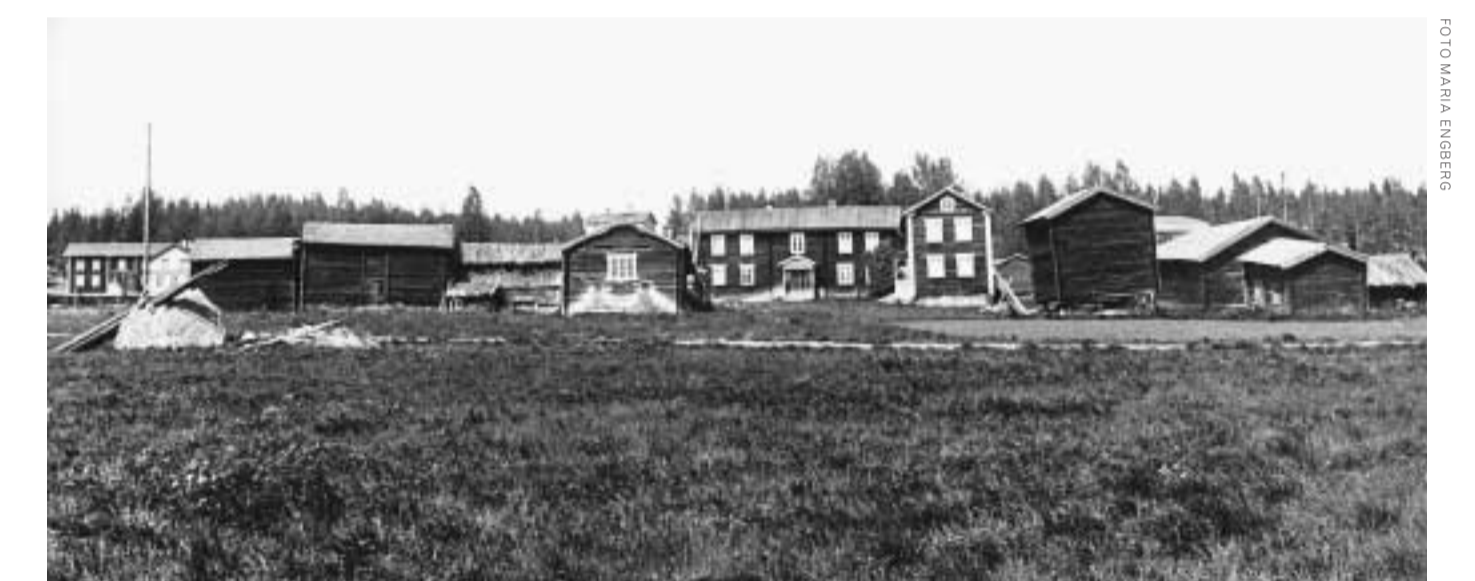
Gårdarna i Knåda ligger tryckta mot skogskanten i norr.

År 1843 hade Knåda marknad fått så stor betydelse att den skrevs in i almanackan och blev en nationell handelsmarknad. Det medförde att den ökade ytterligare i omfång och hade sin absoluta glansperiod 1850–1867, samtidigt som den nya tiden bröt in och Edsbyn tog plats som nytt handelscentrum i bygden.