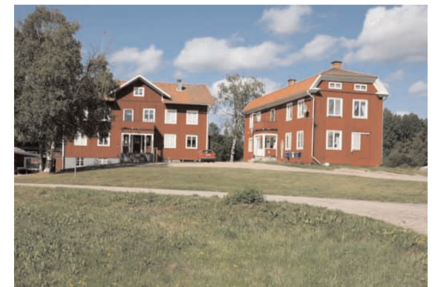
Gården Olpas där marknaden en gång höll till.

Den gamla marknadsgatan i Knåda heter idag Bodgatan och är alltså en handelsgata.